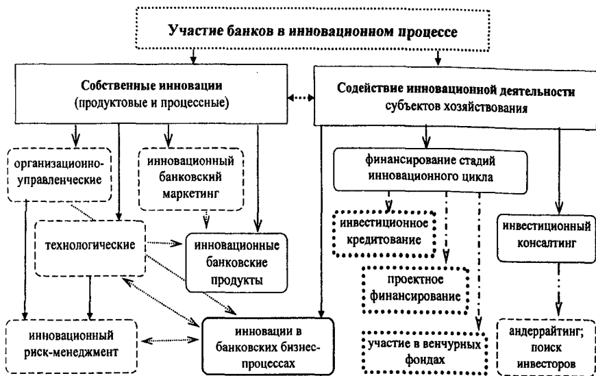
Рис. 1. Формы участия банков в инновационном процессе

Новшества в розничном сегменте банковского бизнеса возникают, прежде всего, как собственные продуктовые и процессные инновации. Они предполагают совершенствование форм и методов организации и управления в банке, изменение регламента работы, повышение доступности банковских услуг для максимально широкого круга потребителей – физических лиц.