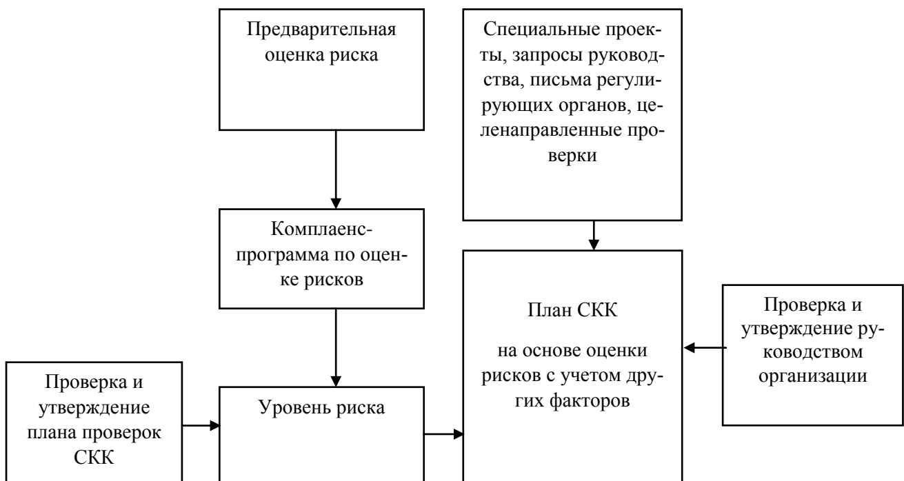
Рисунок 1. – Планирование системы комплаенс-контроля в коммерческих организациях

Для организации системы комплаенс-контроля в коммерческой организации рекомендуем разработать и утвердить план внедрения комплаенс-контроля.