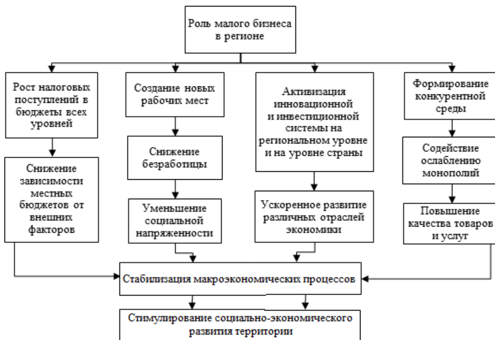
Рисунок 1. – Роль малого бизнеса в экономическом развитии региона [3]

Автором проведено исследование малого бизнеса в регионе на примере Луганской Народной Республики. Это типичный старопромышленный регион со сложной экономической и политической ситуацией. В условиях нестабильной политической и экономической ситуации на территории Луганской Народной Республики развитие малого бизнеса является одним из условий перехода республики к полноценным рыночным отношениям, устойчивому экономическому росту, а также обеспечению стабильности в социально-экономическом развитии региона.