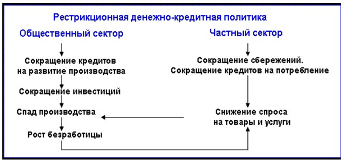
Рисунок 1. – Схема рестрикционной денежно-кредитной политики