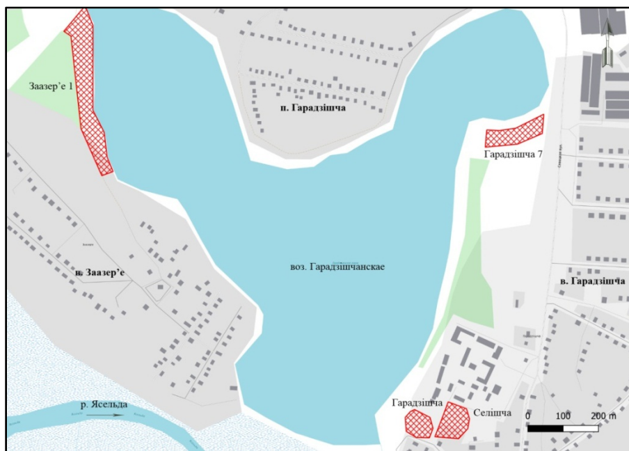
Малюнак 1. – Месцаразмяшчэнне помнікаў вакол возера Гарадзішчанскае. На аснове Latlon.map

Мажлівасць засялення берагоў возера ў перыяд алерода падцвярджаецца радыёвугляроднымі датыроўкамі арганічных адкладаў з балота Іванісаўка, якое размешчана на тэрыторыі Пінскага раёна, у 18 км на паўночны ўсход ад воз. Гарадзішчанскае. На іх паставе можна меркаваць, што ў дадзенай мясцовасці існавалі саснова-бярозавыя лясы разам з разнатраўем [3, с. 54].