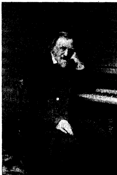
Напалеон Орда.

У лютым гэтага года мінула 210 гадоў з дня нараджэння Напалеона Орды – беларускага мастака, кампазітара, педагога, навукоўца. На яго жыццёвым шляху былі і рамантычныя юнацкія захапленні, і турэмнае зняволенне, і вайсковыя баталіі, і выгнанні, і далёкія вандраванні.