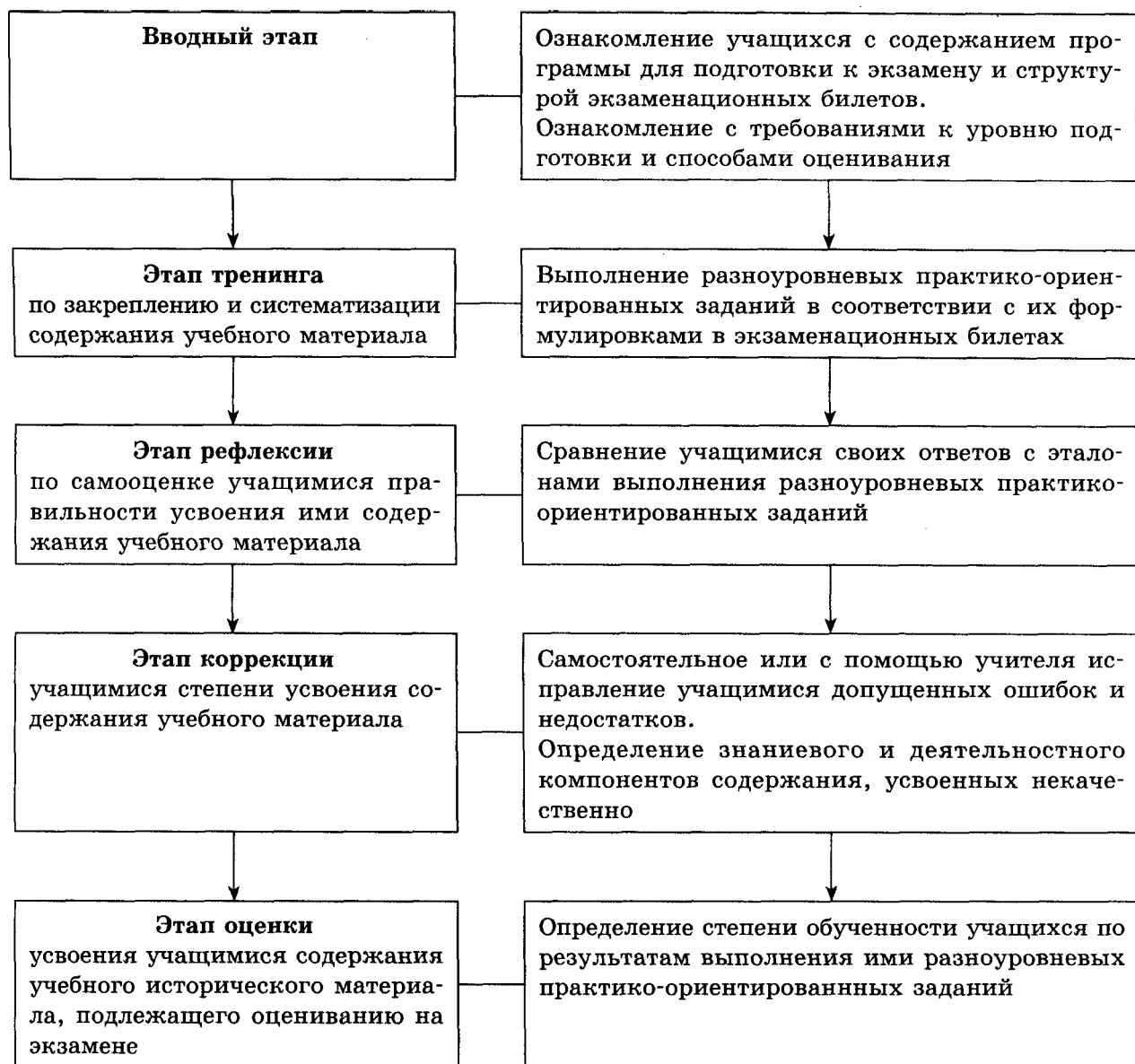
Схема — Алгоритм предэкзаменационной подготовки учащихся

• картографические знания и умения локализовать исторические факты на исторической карте как источнике учебной информации с использованием её «легенды», характеризовать геополитическое положение;