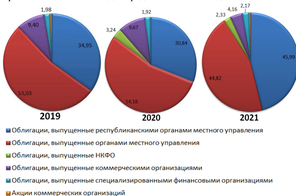
Рисунок 3. – Структура ценных бумаг ОАО "Белагропромбанк", имеющих в наличии для продажи за 2019-2021 гг., %

На рисунке 3 представлена структура ценных бумаг ОАО "Белагропромбанк", которые имеются в наличии для продажи 2019-2021 годы.