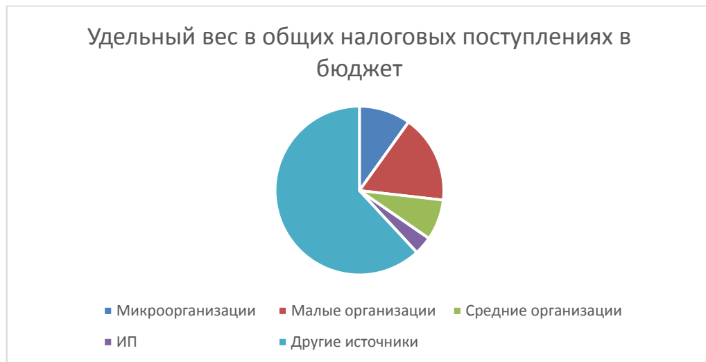
Рисунок 2. – Удельный вес предприятий малого, среднего бизнеса и индивидуальных предпринимателей в общих налоговых послаблениях в бюджет Источник: [2]

предпринимателей. Это означает, что примерно каждый 35 гражданин в республике - зарегистрированный индивидуальный предприниматель [3].