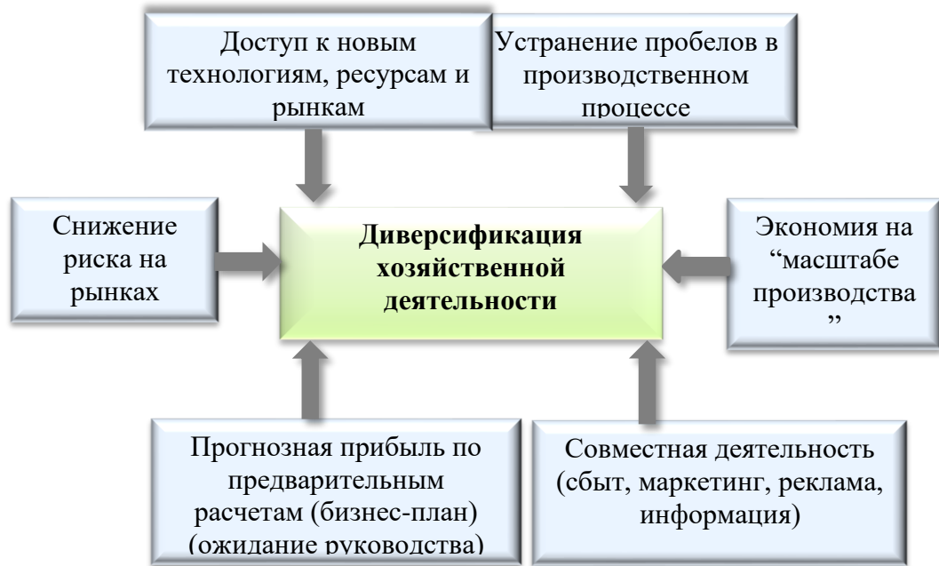
Рисунок 2– Мотивы диверсификации

Примечание – Рисунок составлен автором на основании [2]