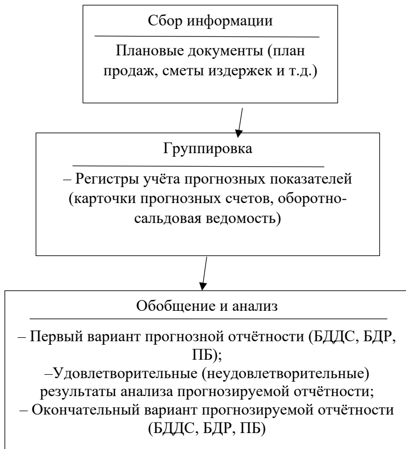
Рисунок 2 – Модель бухгалтерского бюджетирования

Основные прогнозные показатели деятельности организации рассчитываются традиционными методами планирования. Эти показатели должны соответствовать исходным целевым установкам, параметрам, среди которых можно выделить внешние, которые оказывают влияние на прогнозируемые финансовые показатели извне и