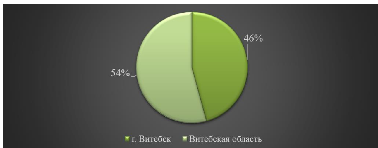
Рисунок 2 – Внутренний рынок сбыта строительных работ ОАО «Строительный трест №9, г. Витебск»

Основным рынком сбыта строительных работ ОАО «Строительный трест №9, г. Витебск» в 2021 году был внутренний рынок Республики Беларусь, который сегментировался следующим образом: г. Витебск – 45,8% (оценка) объема реализованных строительных работ, Витебская область – 54,2% (оценка), соответственно.