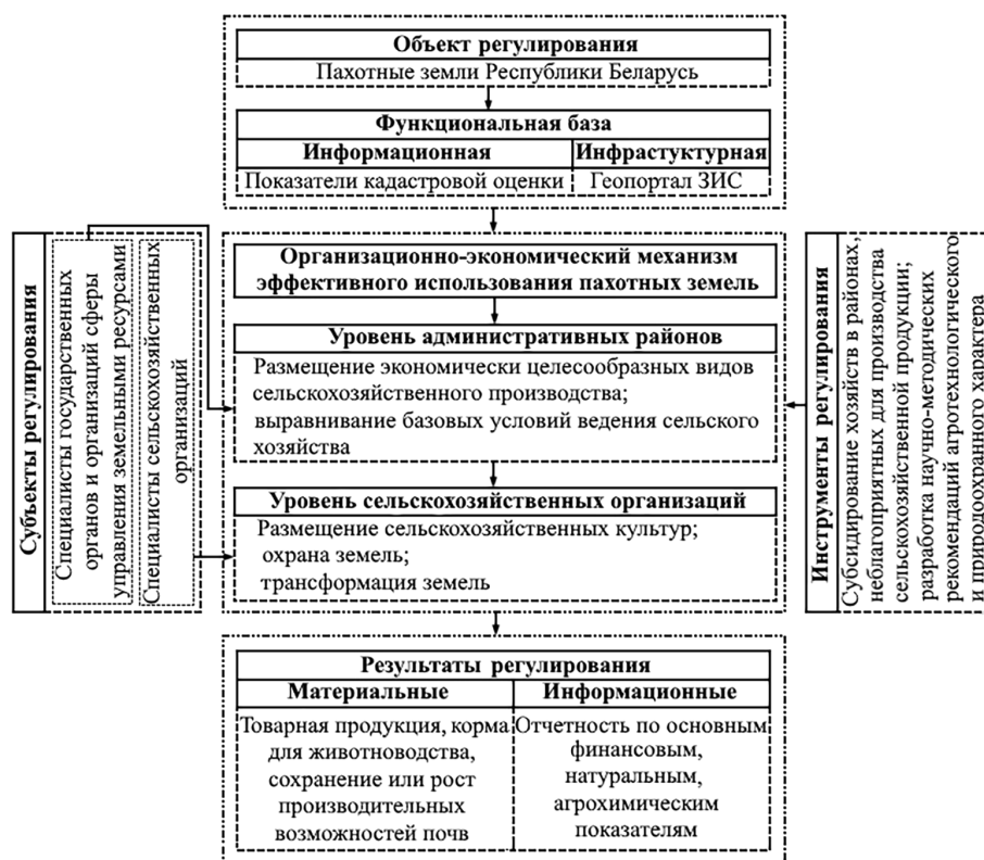
Рис. 2. Модель существующего организационно-экономического механизма использования пахотных земель

Следует отметить, что причисление к системообразующим элементам функционирования данного механизма таких структурных составляющих, как «кадастровая оценка» и «Геопортал земельно-информационной системы», соотносится с законодательно закрепленными направлениями социально-экономического развития и информатизации государства. Так, в соответствии с Программой социально-экономического развития Республики Беларусь на 2021–2025 годы