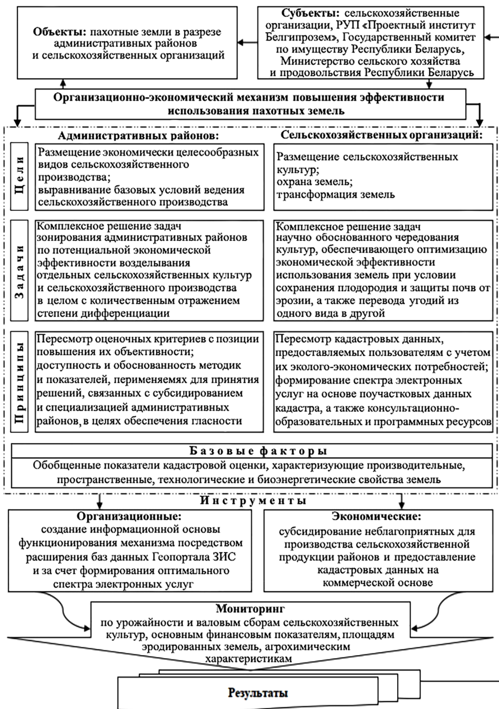
Рис. 3. Организационно-экономический механизм повышения эффективности использования пахотных земель