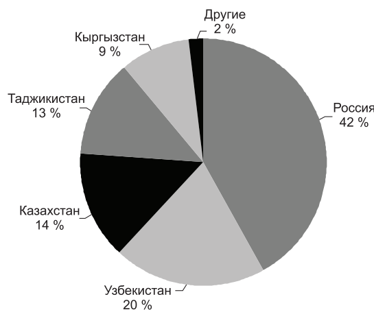
Рис. 3. Структура экспорта древесно-стружечных плит в Республику Беларусь в разрезе стран

Практически весь объем экспорта древесно-стружечных плит из Республики Беларусь приходится на страны СНГ (98 %) и лишь незначительная часть (2 %) – на другие страны ближнего и дальнего зарубежья (рис. 3).