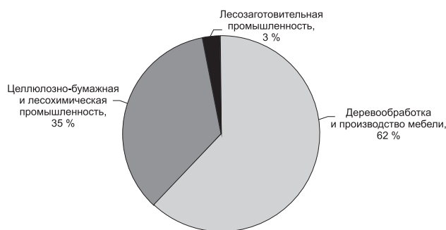
Рис. 1. Структура лесной, деревообрабатывающей и целлюлозно-бумажной отраслей за 2014 год

Одной из старейших и крупнейших отраслей промышленности в Республике Беларусь является деревообрабатывающая. На ее долю приходится примерно 2 % от общего объема производства обрабатывающей отрасли страны, а в структуре лесной, деревообрабатывающей и целлюлозно-бумажной отраслей промышленности – 62 % (рис. 1) [1].