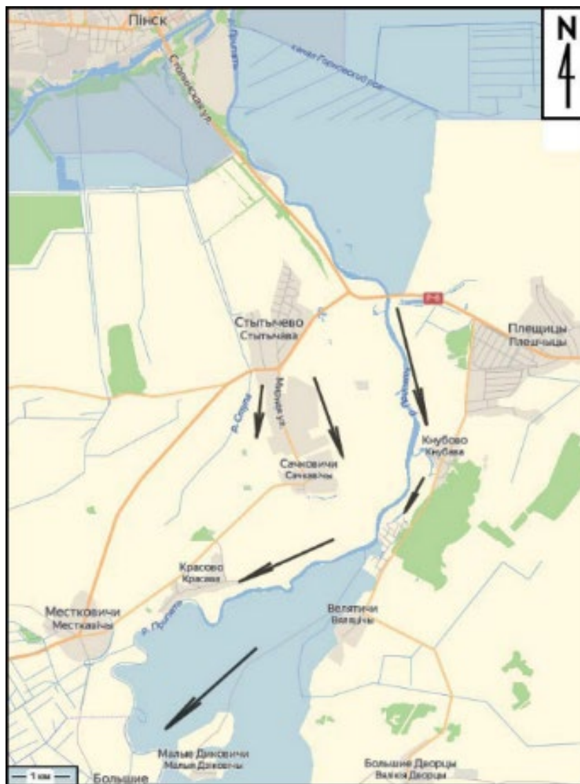
Малюнак 1. Карта маршрута археалагічных разведак, праведзеных у 2022 г. на тэрыторыі Пінскага раёна Брэсцкай вобласці.

супрацьлеглым, правым беразе Прыпяці каля вёсак Кнубава, Веляцічы, Малыя Дзікавічы. На левым беразе Прыпяці намі былі ўпершыню агляданы паселішчы Стытычава 1, Сачкавічы 1, Красава 1, на правым – абследаваны вядомы помнік Кнубава 1, а таксама зафіксаваны новыя помнікі Кнубава 2, Веляцічы 1, Малыя Дзікавічы 1, Малыя Дзікавічы 2.