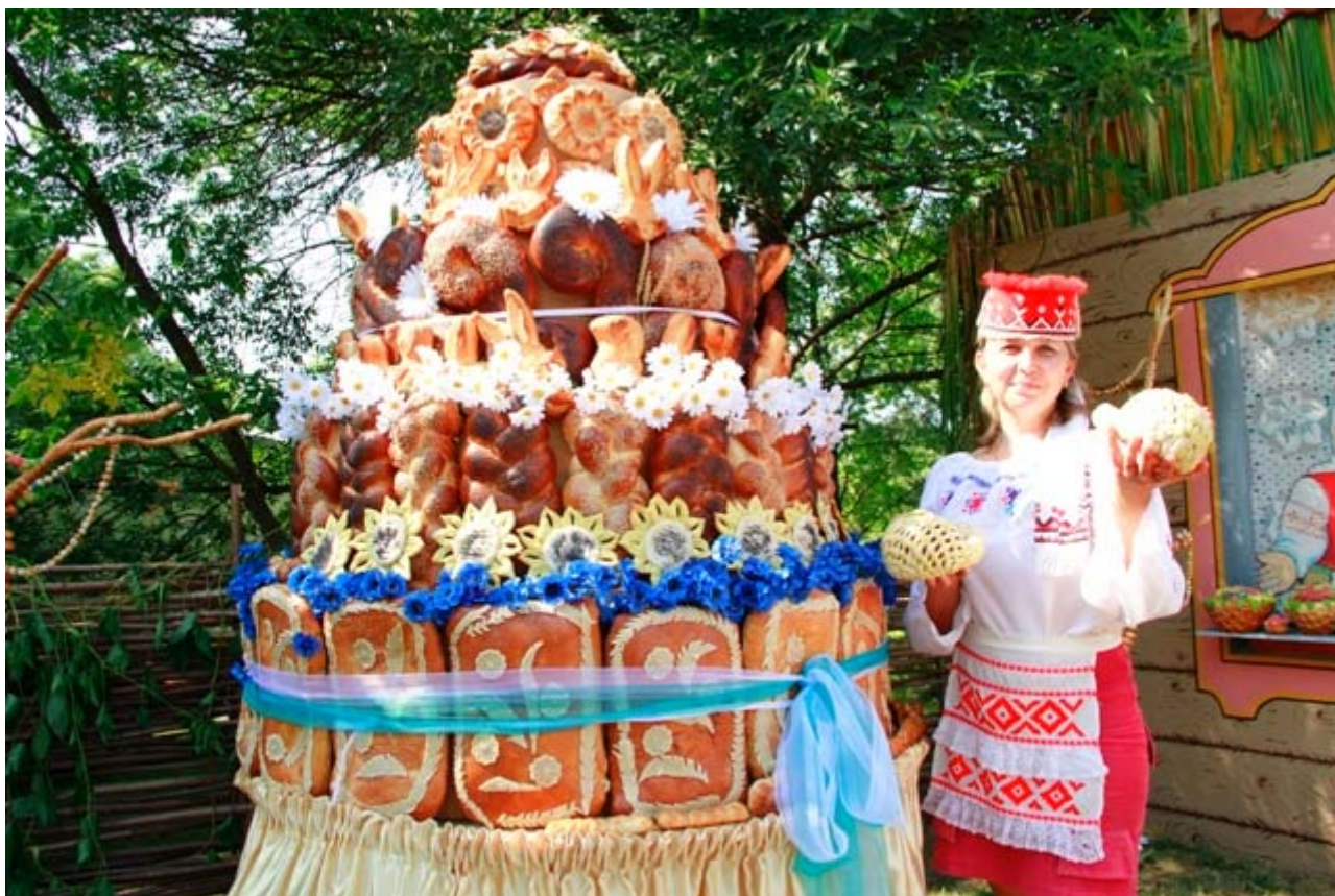
Рисунок 6. Фестиваль "Мотальскія прысмакі".

За это время он превратился в настоящий бренд Ивановского района и Брестской области. В 2015 году мероприятие приобрело международный статус. В 2019 году прошел X юбилейный фест "Мотальскія прысмакі" гостями которого стали делегации из Грузии, Алжира, Македонии, Латвии, Литвы, Турции, Польши, Чехии, Израиля, России, Украины и Беларуси [2].