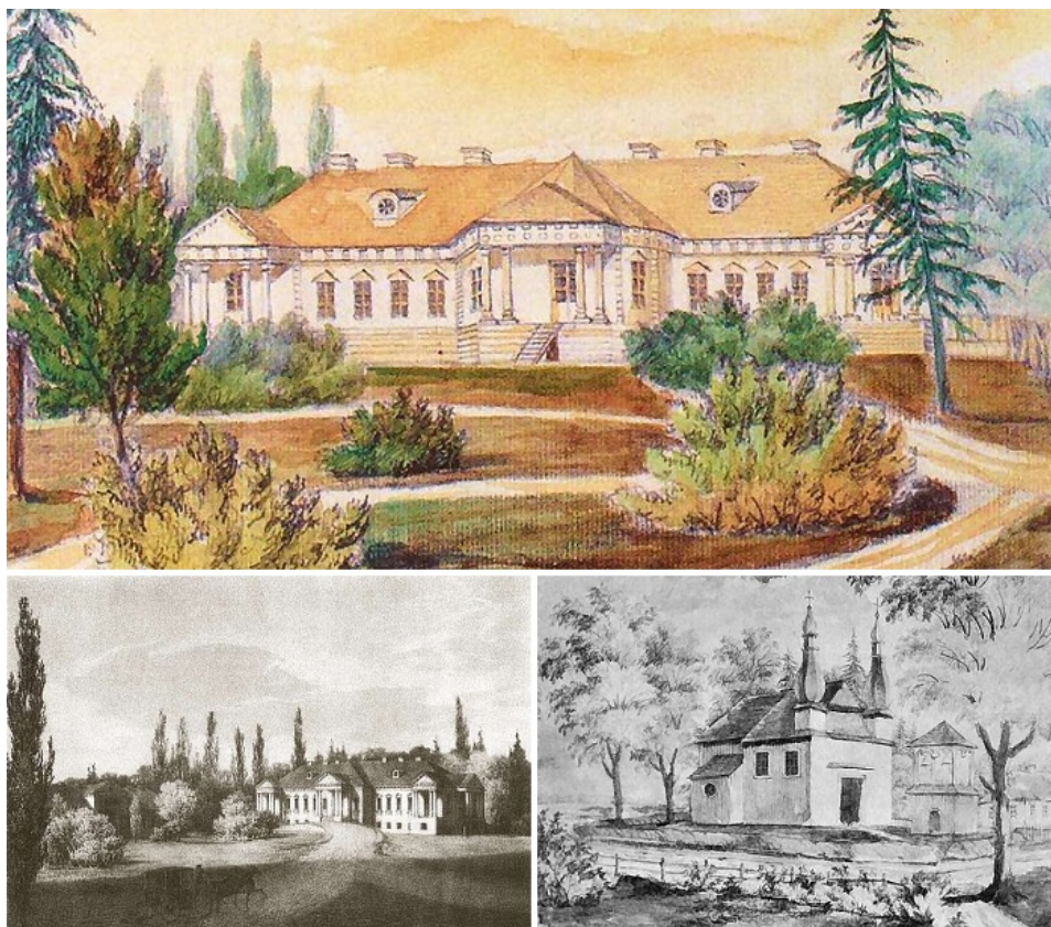
Рисунок 8. Усадьба Скимунтов, эскиз рисунка Наполеона Орды. В нижнем правом углу изображена церковь Вознесения Господня XVIII век.

Вот так, в своих воспоминаниях описывала дворец француженка Р. Бели: «Он как мечта при свете луны под чудесную музыку Моцарта. Колонны подобны лилии, поддерживающие гирлянды, фасад, как снежное изваяние разворачивает лёгкие и полные грации и мотивы». Вокруг постройки был разбит парк в английском стиле, где была собрана обширная ботаническая коллекция. Во время Первой мировой войны усадьба была разграблена, однако после войны ущерб сумели восстановить. Во время Великой Отечественной войны село находилось под оккупацией, дворец и прочие приусадебные постройки сгорели и были до основания разобраны в послевоенное время. От усадебного комплекса сохранилась лишь часовня-ротонда и несколько фамильных надгробий Скимунтов рядом с ней.