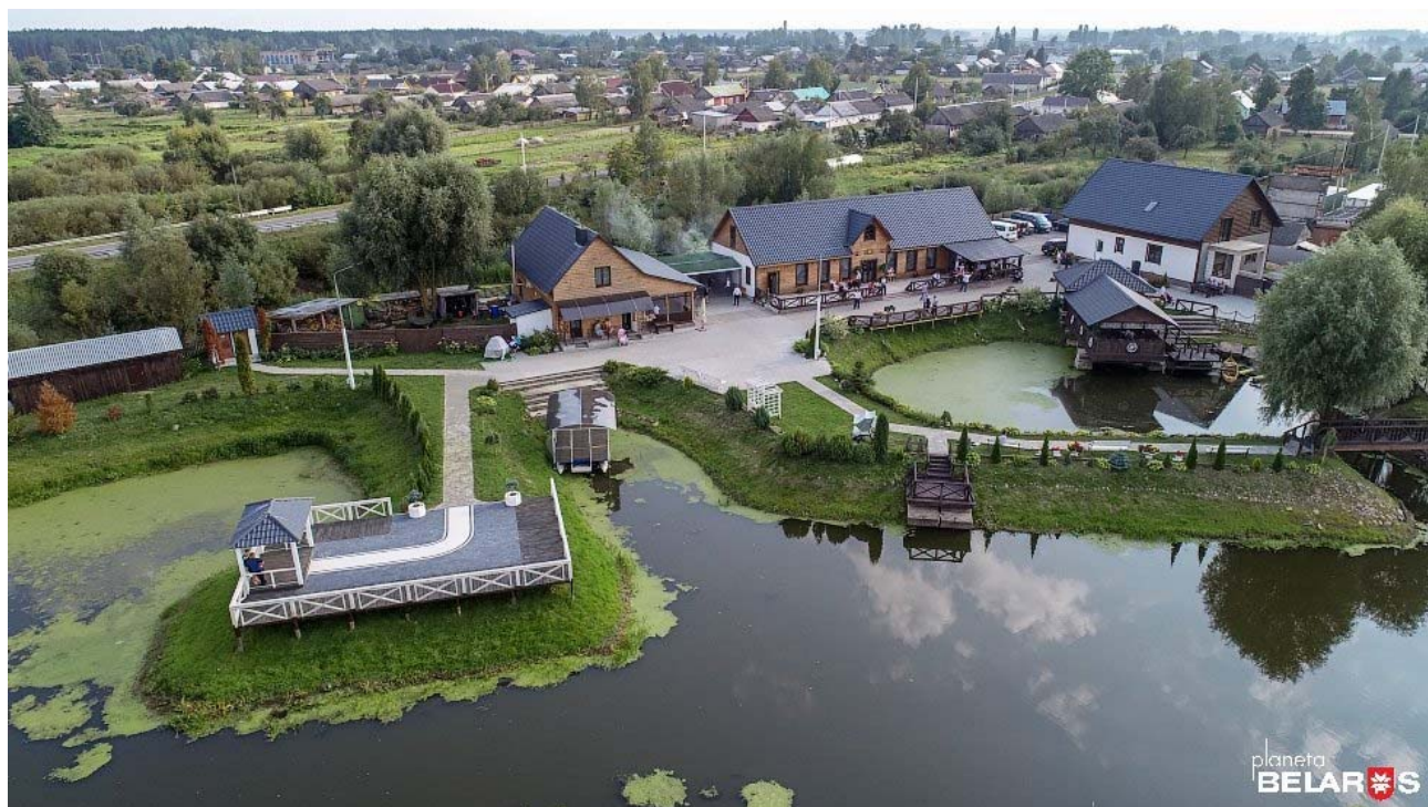
Рисунок 11. Агроусадьба "Мотольская Венеция".

Автор полагает, что агрозкотуризм в Республике Беларусь в будущем станет полноправным сектором туристической отрасли.