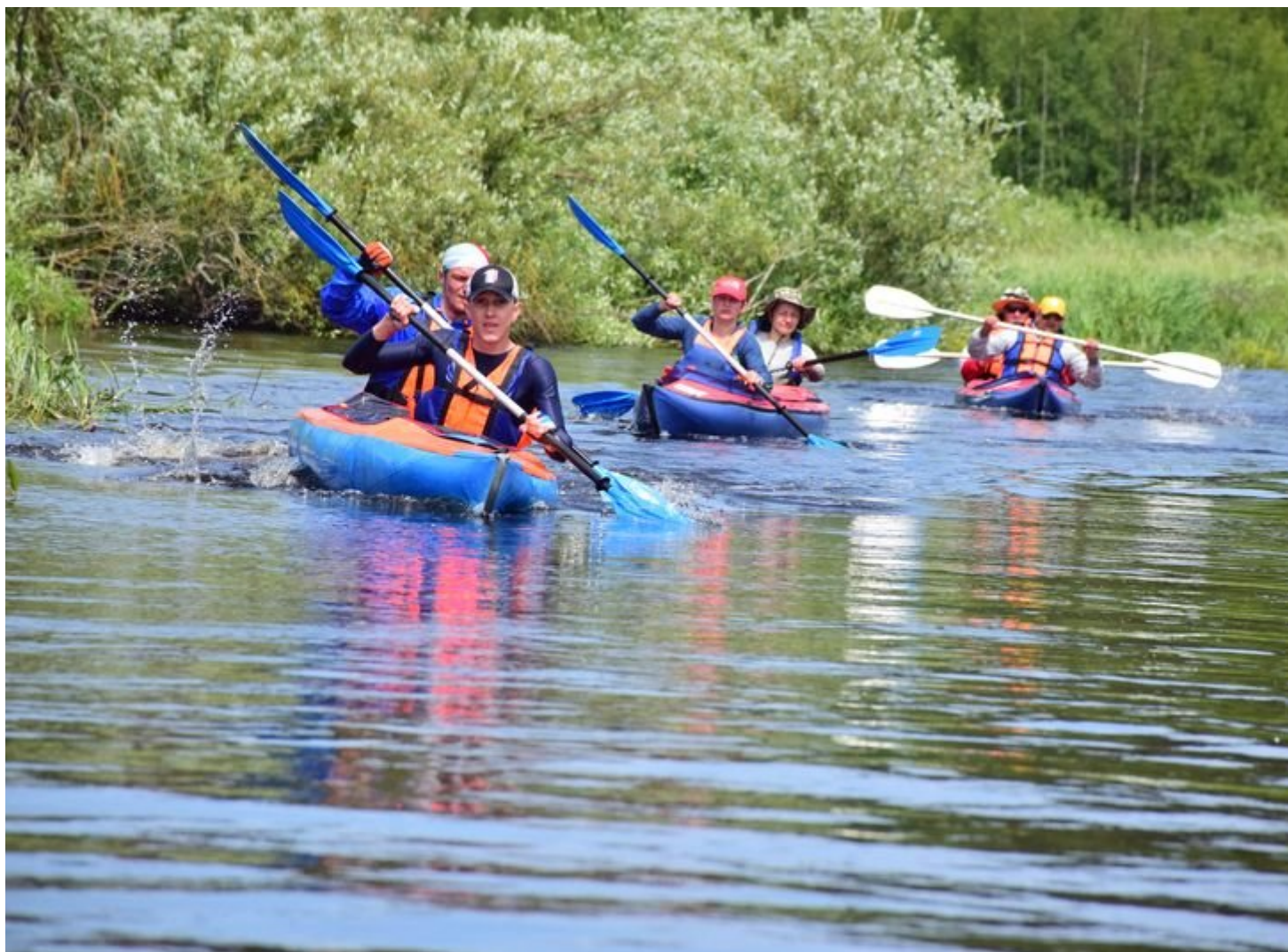
Рисунок 7. Мотольская регата.

Сплав байдарок традиционно проходит в первые выходные лета на территории Березовского и Ивановского районов. Проверить себя на прочность, а также умение пользоваться веслами, байдаркой и водной картой сюда приезжают из разных уголков Беларуси и России. В соревнованиях принимают участие как мужские экипажи, так и смешанные.