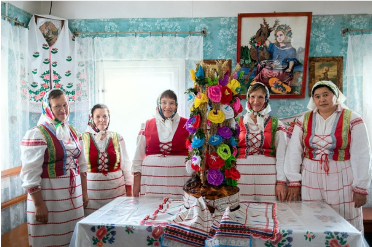
Рисунок 2. Вясельны каравай.

использовали для хлебопечения в XIX-XX веке. Музей функционирует на базе предприятия, специализирующегося на изготовлении хлебобулочных изделий "Аникс Саниа". Для организованных групп владельцы музея проводят кулинарный мастер-класс и знакомят с белорусскими обрядами. Экскурсовод музея расскажет об особенностях хлеба, который выпекали на различные праздники, о ритуалах, сопутствующих процессу. Особенный интерес вызывает обряд "Вясельны каравай", который называют здесь "гаспадаром".