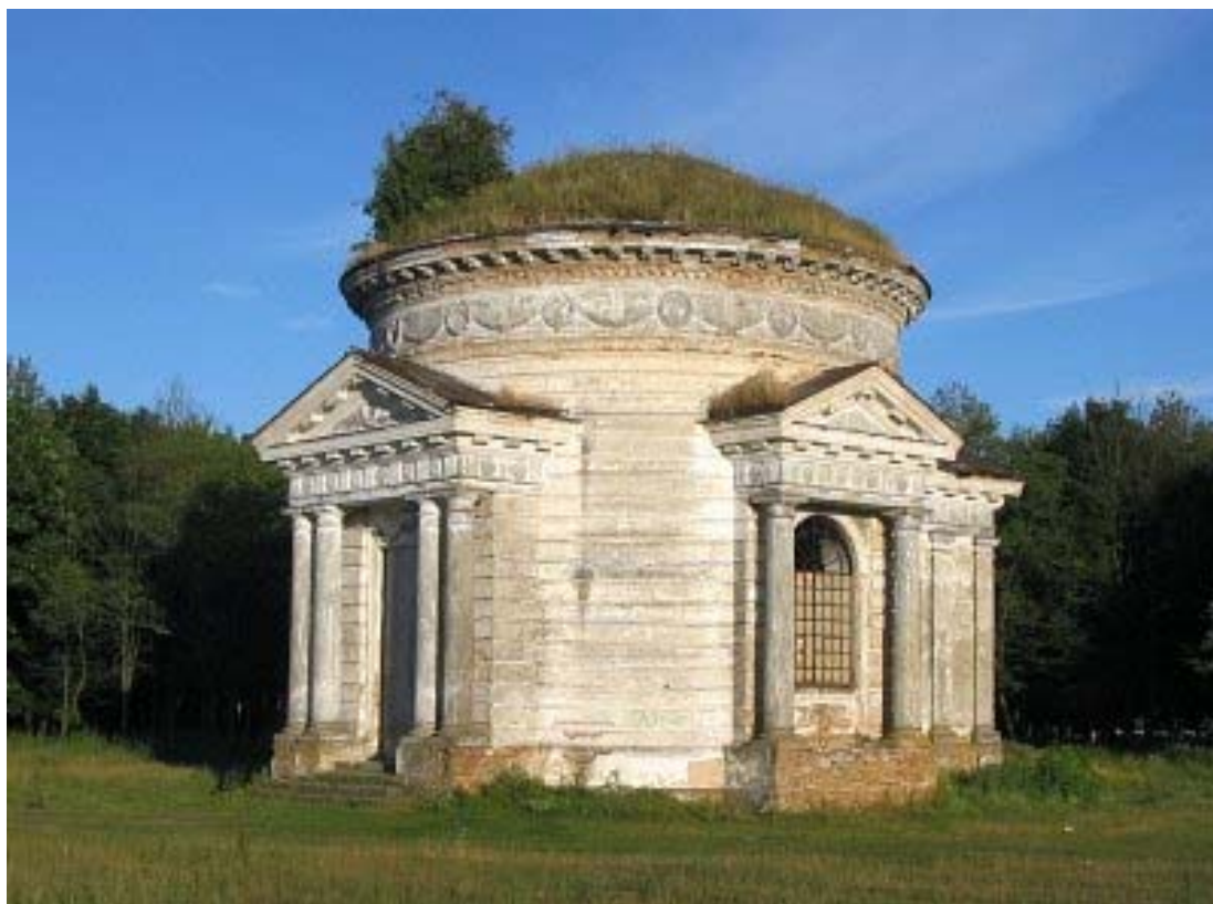
Рисунок 9. Часовня Скирмунтов, вид сегодня.

Еще одна достопримечательность Молодова является церковь Вознесения Господня. Деревянная православная церковь конца XVIII века. Памятник народного деревянного зодчества. В начале XXI века рядом с ней построена новая каменная церковь. Между этими двумя церквями возвели небольшую колокольню, в которую перенесли колокол из старой деревянной церкви. Этот колокол был отлит в 1583 году и является самым древним на территории Беларуси.