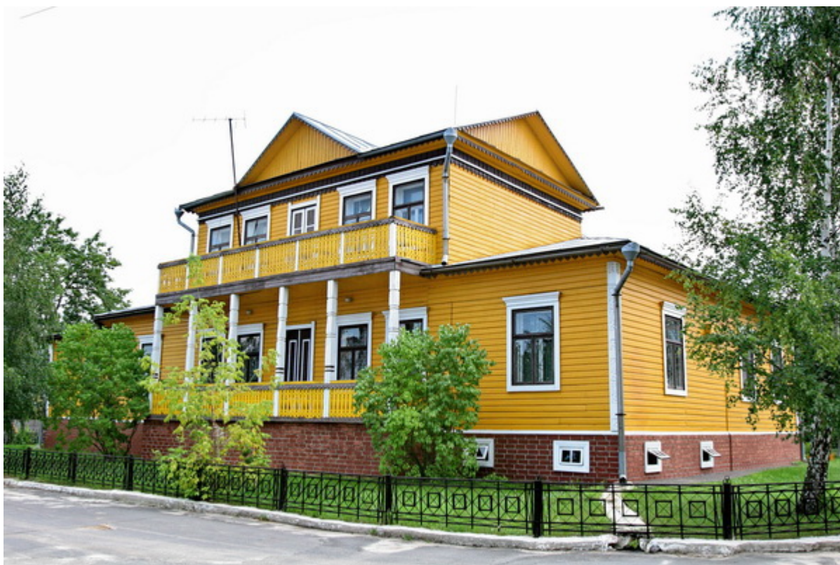
Рисунок 1. Музей народного творчества в Мотоле.

Музей народного творчества состоит из восьми экспозиционных залов: истории крестьянского быта, народных ремёсел, земледелия, льнообработки, ткачества, народной одежды, праздников и обрядов.