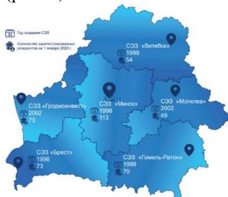
Рисунок 2 – Количество действующих резидентов на 01.01.2022 г.

(или 17%) в СЭЗ «Брест», 68 предприятия (или 16%) в СЭЗ Гомель-Ратон, 111 предприятий (или 26%) в СЭЗ Минск, 54 предприятия (или 13%) в СЭЗ Витебск, 45 предприятий (или 11%) в СЭЗ Могилев, 71 предприятия (или 17%) в СЭЗ Гродноинвест (рис. 2).