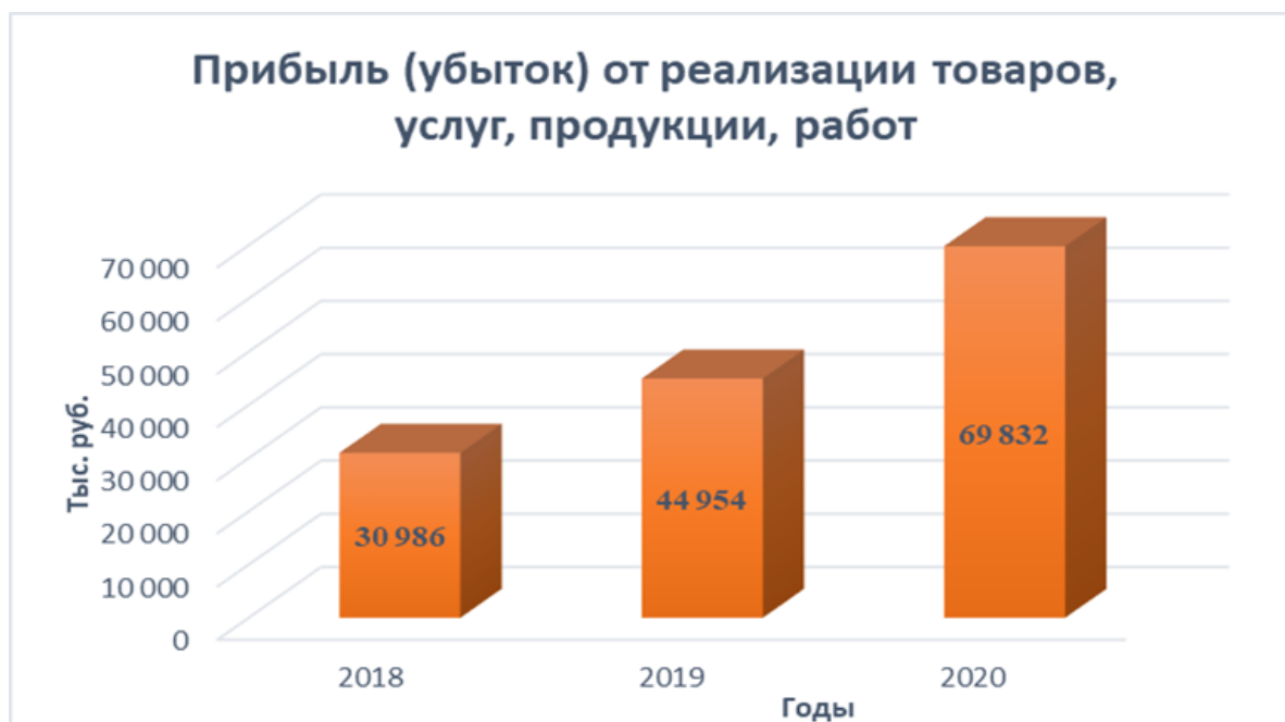
Рисунок 2. Диаграмма изменения прибыли ОАО "МАЗ"

Валовая прибыль, как основной показатель эффективности работы, за 2020 год составила 192 189 тыс. рублей. В 2018 году валовая прибыль была в размере 149 761 тыс. рублей. Валовая прибыль увеличилась на 42 428 тыс. рублей.