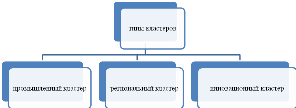
Рисунок 2 – Типы кластеров в научной литературе

Инновационный кластер – это целенаправленно сформированная группа предприятий, функционирующих на базе центров генерации научных знаний и бизнес-идей, подготовки высококвалифицированных специалистов.