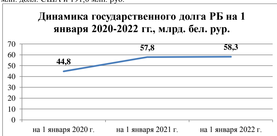
Рисунок 1. – Государственный долг РБ на 1 января 2020 – 2022 гг.

Далее охарактеризуем внутренний государственный долг, который по состоянию на 1 января 2022 года составил 11,8 млрд. руб., увеличившись с начала года на 2 млрд. руб. ( с учетом курсовых разниц ), или на 19,9%. Он увеличился, т.к. в 2021 году размещено внутренних валютных и рублевых государственных облигаций для юридических и физических лиц на сумму, эквивалентную 1 237,8 млн. долл. США и 191,0 млн. руб.