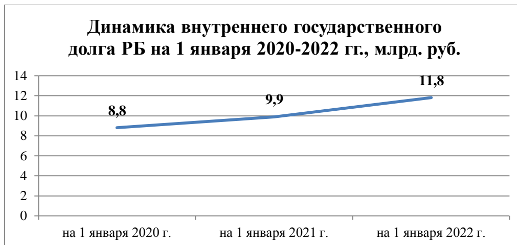
Рисунок 2. – Внутренний государственный долг РБ на 1 января 2020 – 2022 гг.

Динамика внутреннего государственного долга Республики Беларусь представлена на рисунке 2.