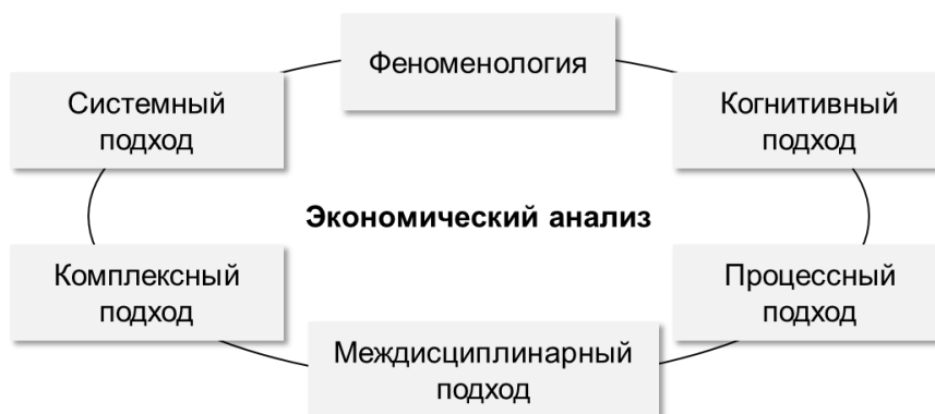
Рисунок 1. – Методологические основы экономического анализа в современных условиях

Известно, что правовой основой любой рациональной экономической деятельности является двух- или многосторонняя сделка, которая может быть заключена и оформлена как в виде подписанного договора, так и заключена на основе предложения в виде публичной оферты, дистанционно.