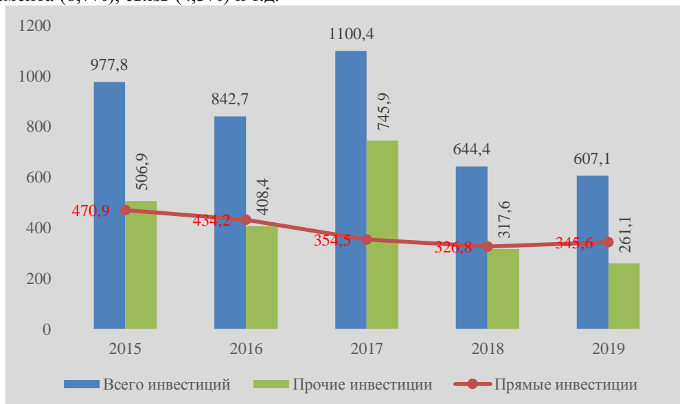
Диаграмма 1. – Динамика поступлений иностранных и прочих инвестиций в РТ за 2015-2019гг. Составлено автором по данным Ежегодного статистического сборника РТ

С 2015 по 2017 гг. прямые иностранные инвестиции были направлены в основном, на такие виды экономической деятельности, как строительство ГЭС (923,8 млн.дол.США), добыча видов драгоценных металлов, руд редких металлов и свинцово-цинковой руды (592,7 млн.дол.США), а также добыча нефти и природного газа (402,9 млн.долларов США). В 2016 году инвестиционно привлекательным сектором являлась добыча нерудных строительных материалов (113,4 млн.долларов США). Инвестиции в остальные отрасли в своей совокупности составляли 40-70 млн.долларов США. К последним относится производство благородных металлов (4,8% к общему объему инвестиций), цемента (8,7%), связь (4,3%) и т.д.