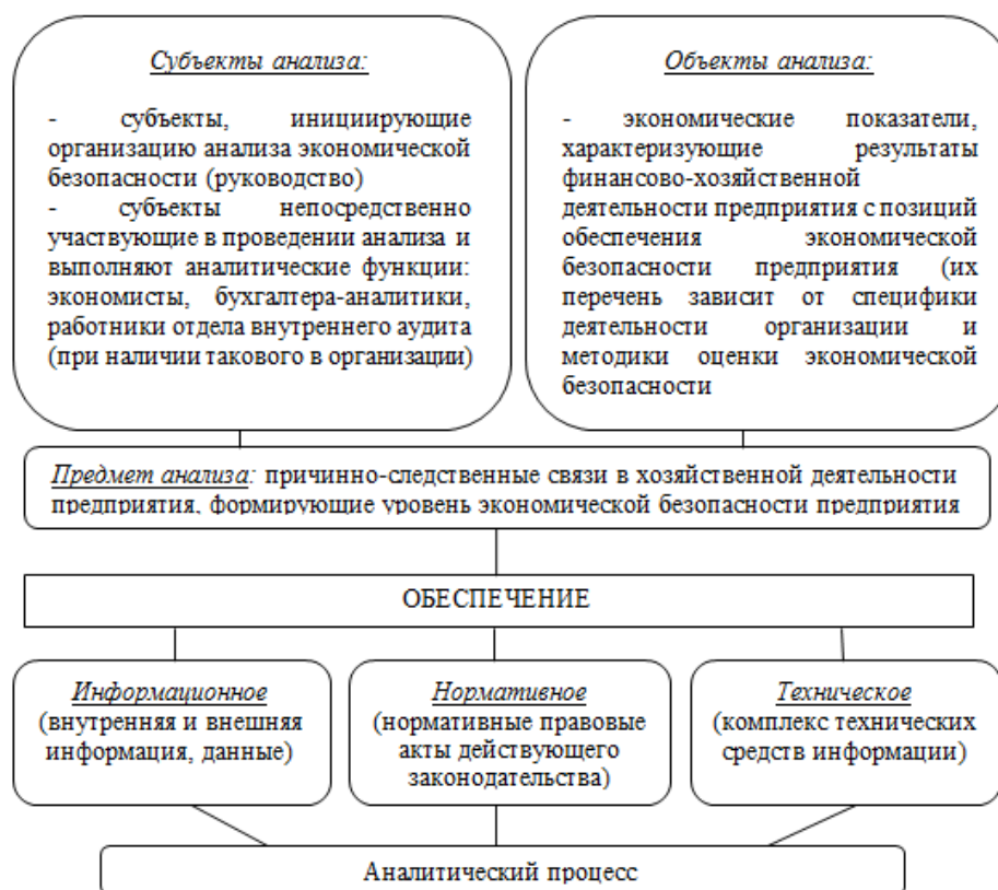
Рисунок 1 – Основные элементы организации анализа экономической безопасности на предприятии

Организацию анализа экономической безопасности целесообразно рассматривать как систему, состоящую из взаимосвязанных элементов, находящихся в постоянной связи (рисунок 1).