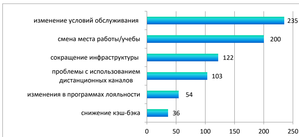
Рис. 3. Распределение участников опроса по критериям, определяющим переход на обслуживание в другой банк, чел.

Ответы на вопрос о наиболее существенных условиях, которые могут стать причиной перехода на карточное обслуживание в другой банк распределились следующим образом (рис. 3). Был предложен выбор из нескольких вариантов ответа или указание собственного варианта.