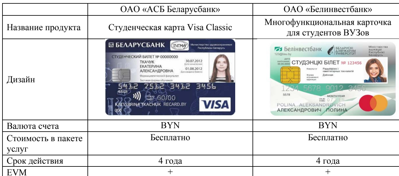
Таблица – Характеристики банковских продуктов «Студенческая карта» ОАО «АСБ Беларусбанк» и ОАО «Белинвестбанк»

Примечание – Источник: собственная разработка по данным [1-2]