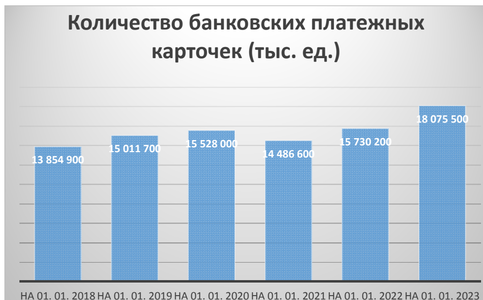
Рисунок 3. – Количество банковских платежных карточек (тыс. ед.)

Динамику изменения количества банковских платежных карт с 01.01.2018 по 01.01.2023 можно проследить на рисунке 3.