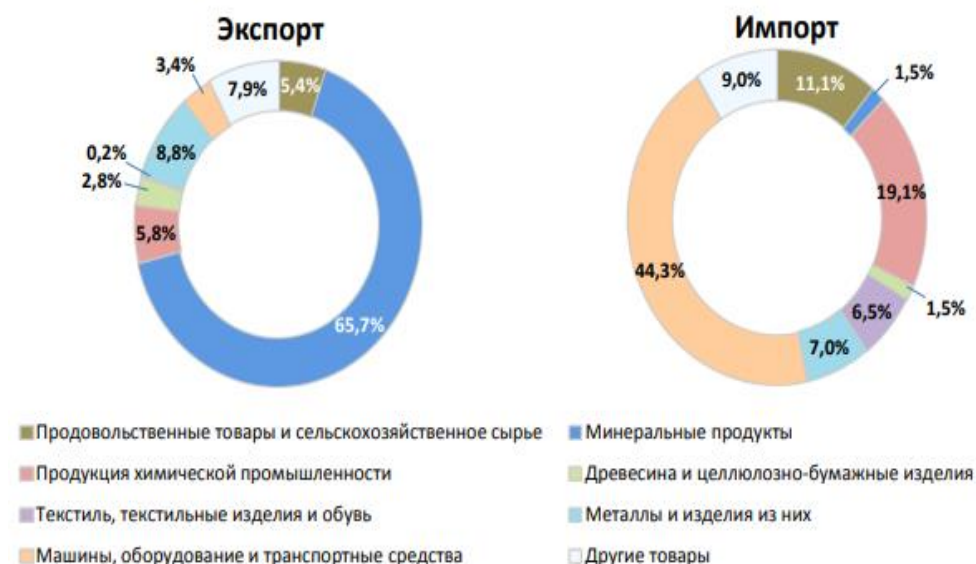
Рисунок 3. – Структуру экспорта и импорта товаров во внешней торговле за 2021 года (в процентах к итогу по ЕврАзЭС)

В товарной структуре экспорта государств-членов ЕАЭС в третьи страны преобладают минеральные продукты (65,7% общего объема экспорта государств-членов ЕАЭС в третьи страны), металлы и изделия из них (8,8%), продукция химической промышленности (5,8%). Около 80% этих товаров продает на внешнем рынке Российская Федерация.