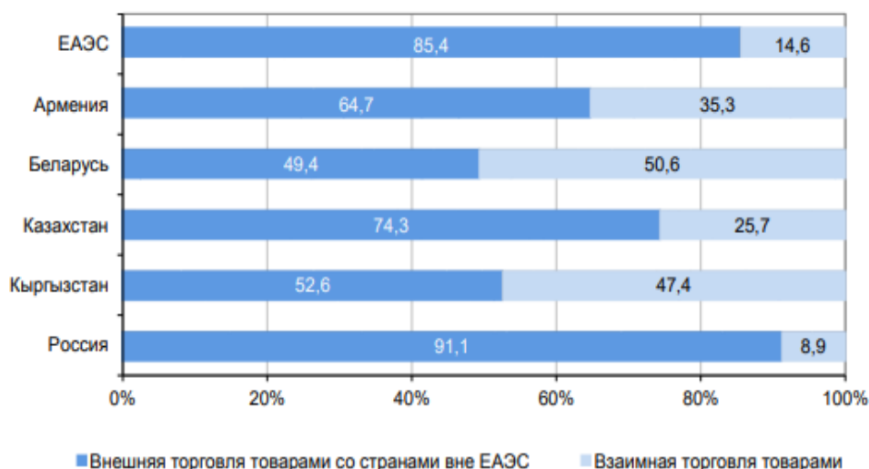
Рисунок 4. – Удельный вес взаимной торговли и торговли со странами вне ЕАЭС в общем объеме внешней торговли по ЕвразЭС в целом и по государствам-членам ЕвразЭС