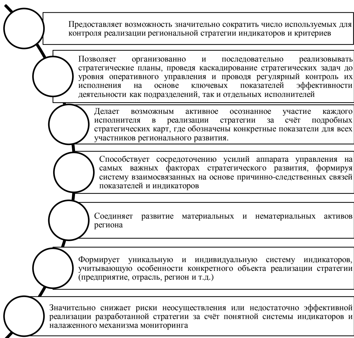
Рисунок 1. – Отличительные характеристики ССП применительно к региональному управлению

Примечание – Рисунок составлен автором на основе [1, 2, 3].