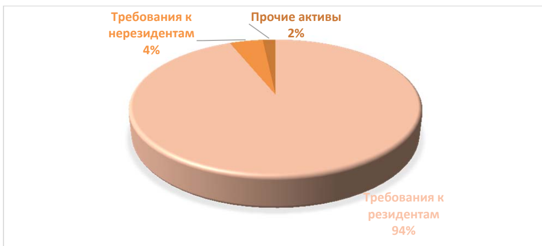
Рисунок 2. – Структура активов банков Республики Беларусь на 01.01.2021 г., % Примечание – Источник: собственная разработка на основании [3]

В структуре активов банков Республики Беларусь за анализируемый период наблюдается устойчивая тенденция роста требований к нерезидентам (рисунки 2,3,4).