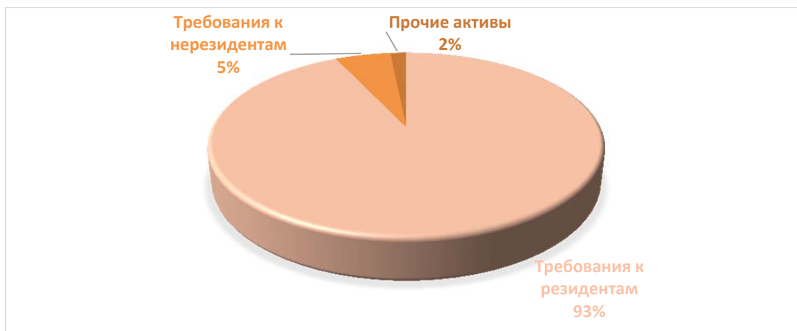
Рисунок 3. – Структура активов банков Республики Беларусь на 01.01.2022 г., %

Примечание – Источник: собственная разработка на основании [2]