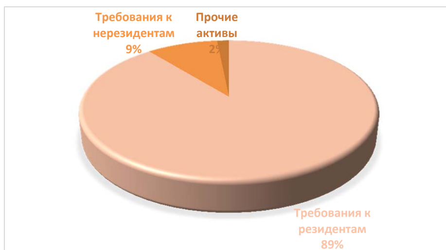
Рисунок 4. – Структура активов банков Республики Беларусь на 01.01.2023 г., %

На 01.01.2023 год требования к резидентам Республики Беларусь составили 88 765,4 млн. рублей, что меньше на 0,02% по сравнению с прошлым годом. Удельный вес требований к резидентам уменьшился на 4 пп. Требования к нерезидентам Республики Беларусь составили 9 255,3 млн. рублей, рост по сравнению с 01.01.2022 составил 78%. Прочие активы составили 1 545,8 млн. рублей, что больше, чем на 01.01.2022 на 3,4% (рисунок 4) [1, с. 209].