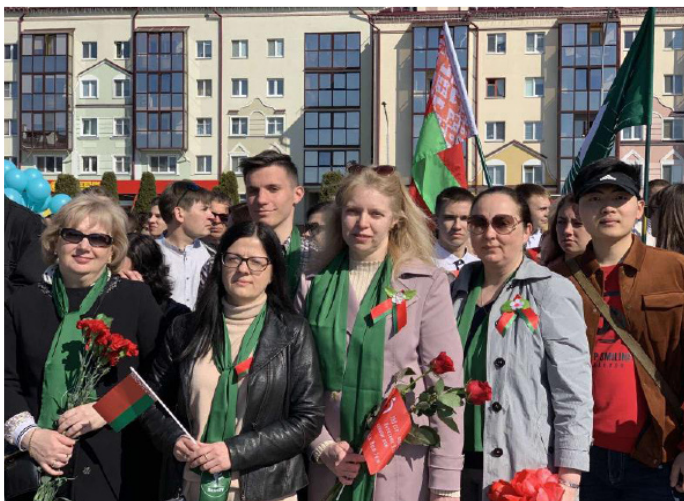
Сотрудники университета приняли участие в Республиканской акции «Беларусь помнит».

9 мая, в День Победы, на главной площади города Пинска прошёл торжественный парад. Студенты, преподаватели и сотрудники Полеского государственного университета, члены первичных организаций «БРСМ», «Белая Русь», «Белорусский союз женщин», представители профкома ПолесГУ приняли участие в мероприятии, на котором отдали дань памяти погибшим и почтили ветеранов и участников Великой Отечественной войны.