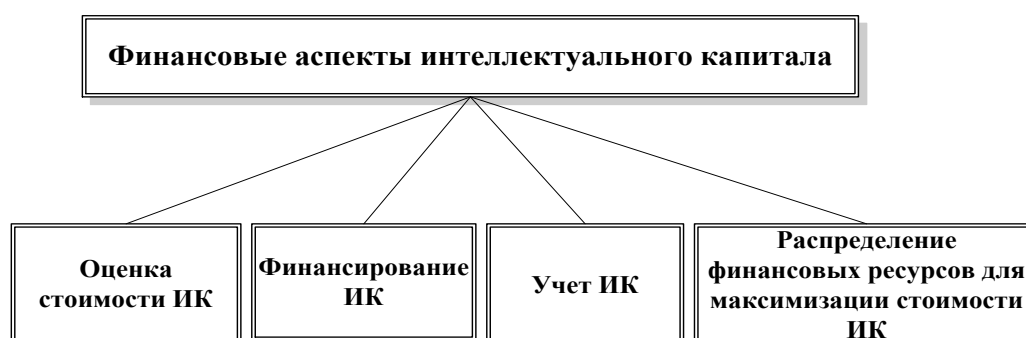
Рисунок 2 – Финансовые аспекты интеллектуального капитала организации

Таким образом, финансовые аспекты интеллектуального капитала включают в себя оценку, финансирование, учет и распределение финансовых ресурсов для развития и поддержки интеллектуальных активов компании (рисунок 2).