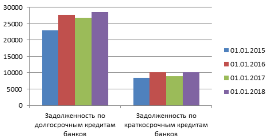
Рис. 2. Динамика задолженности по долгосрочным и краткосрочным кредитам за 01.01.2015-01.01.2018 гг., млн.руб.

Примечание – Собственная разработка на основе [1,2,3]