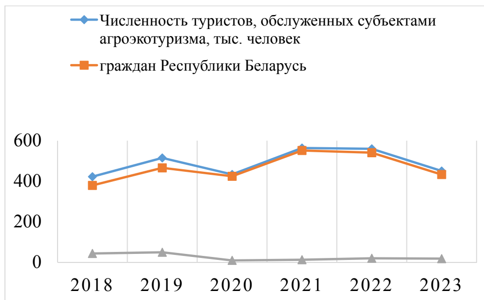
Рисунок 2. – Численность туристов, обслуженных субъектами агротуризма, в период с 2018 по 2023 гг.

Также наблюдался постоянный рост численности туристов, обслуженных субъектами агротуризма (рисунок 2). Например, на начало 2023 г. было обслужено 450,4 тыс. человек, что на 6% больше чем в 2018 г. (432,8 тыс.) Из них, 96% составили граждане Республики Беларусь .