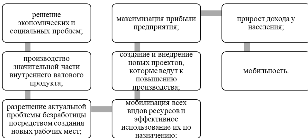
Рисунок 1. Положительные моменты осуществления государственной помощи предприятиям малого и среднего бизнеса

Малый и средний бизнес рассматривается как приоритетная задача государства и включает в себя множество положительных моментов (рис. 1).