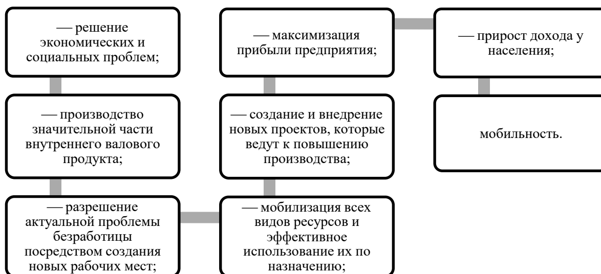
Рисунок 1 – Положительные моменты осуществления государственной помощи предприятиям малого и среднего бизнеса

Малое и среднее предпринимательство в Республике Беларусь имеет важное значение для экономики, поскольку оно способствует созданию рабочих мест, развитию инноваций и повышению конкурентоспособности бизнес-сектора. Понимая это, правительство Республики Беларусь в последние годы предпринимает широкие шаги для стимулирования развития малого и среднего предпринимательства (МСП), включая упрощение процедуры регистрации бизнеса, снижение налоговых ставок и предоставление финансовых гарантий для предпринимателей [1]. На сегодня малый и средний бизнес как приоритетная задача государства включает в себя множество положительных моментов (рисунок 1).