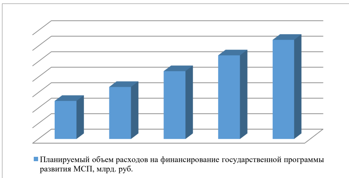
Рисунок 3 – Планируемый объем расходов на финансовое обеспечение реализации Государственной программы [3]

Давайте отметим и планируемый объем расходов на финансовое обеспечение реализации Государственной программы, который представлен на рисунке 3.