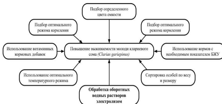
Рис. 2. Способы повышения выживаемости молоди клариевого сома в промышленных условиях

Однако, отдельно среди этих методов выделяется обработка электролизом раствора, поступающего в рыбоводную емкость. При определенном режиме обработки возможно получение раствора католита, позволяющего повысить выживаемость и прочие показатели жизнедеятельности. Данный факт подтверждается массой исследований, которые проводились на различных видах живых организмов и во всех случаях показали положительный эффект.