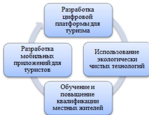
Рисунок 2 – Рекомендации по внедрению инновационных подходов и технологий