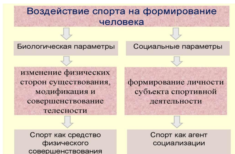
Рисунок 2. Воздействие спорта на личность

Спортивная культура способствует созданию социальных связей и объединяет людей с различными интересами. По данным социологических исследований участие в спортивных командах помогает людям создавать новые знакомства, развивать коммуникативные навыки и улучшать маркеры социальной адаптации.