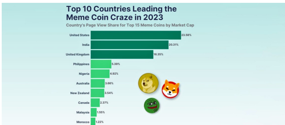
Рисунок 2. – Рейтинг стран по ажиотажному спросу на мемкоины