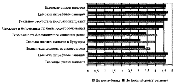
Рис. 1. Основные проблемы в налогообложении (в баллах)

Высокой проблемой в области налогообложения для предпринимателей Бобруйского региона являются высокие штрафы (4,74бал.), которые часто бывают не обоснованны. Налоговые органы не всегда оказывают консультационную помощь представителям малого бизнеса и никогда не прощают нарушений в области налогообложения.