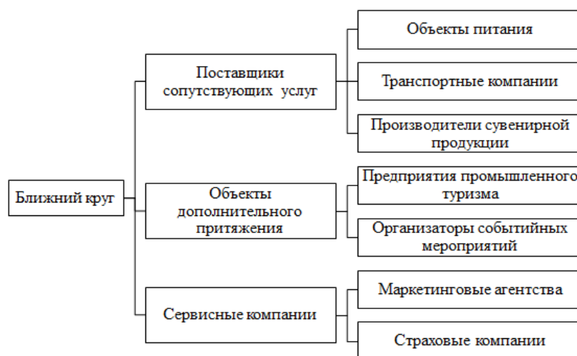
Рисунок 2. – Стейкхолдеры ближнего круга кластера

Примечание – Источник: [Собственная разработка]