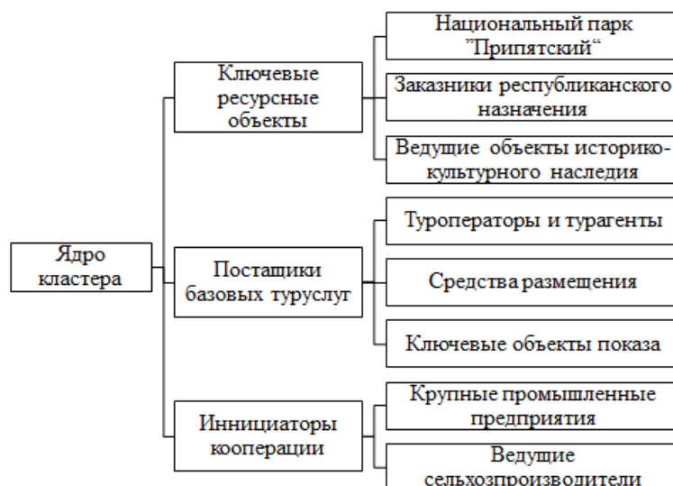
Рисунок 1. – Стейкхолдеры ядра формирующегося туристского кластера

Стейкхолдеры ядра формируют фундамент кластера, создавая первичное предложение и привлекательность территории. Ключевые ресурсные объекты (Национальный парк «Припятский», заказники) выступают в роли естественных точек притяжения, генерирующих основной турпоток. Поставщики базовых услуг (туроператоры, агроэкотуризм) являются интеграторами этого потока, формируя первичные туристические продукты. Особого внимания заслуживает группа «Инициаторы кооперации» – крупные промышленные и аграрные предприятия (ОАО «Беларуськалий», ОАО «Туровщина»), которые, согласно Программе развития, обладают значительным ресурсным и финансовым потенциалом для запуска пилотных проектов (например, в сфере промышленного туризма) и могут выступать катализаторами кооперационных процессов.