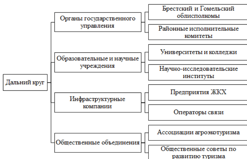
Рисунок 3. – Стейкхолдеры дальнего круга кластера

Органы государственного управления выполняют функции стратегического планирования, координации и финансирования. Образовательные учреждения ответственны за воспроизводство человеческого капитала и генерацию инновационных идей для кластера.