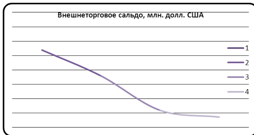
Рисунок 2 – Изменение внешнеторгового сальдо Республики Беларусь 2006-2009 гг.

Причин такого положения существует множество: низкая эффективность внешней торговли, недостаточная рентабельность экспорта, необходимость более полного правового обеспечения внешней торговли, однако основной причиной отрицательного внешнеторгового сальдо является высокая зависимость республики от импортируемых энергоресурсов, в частности из России, что во многом объясняет высокий удельный вес импорта из России в общем его объеме.