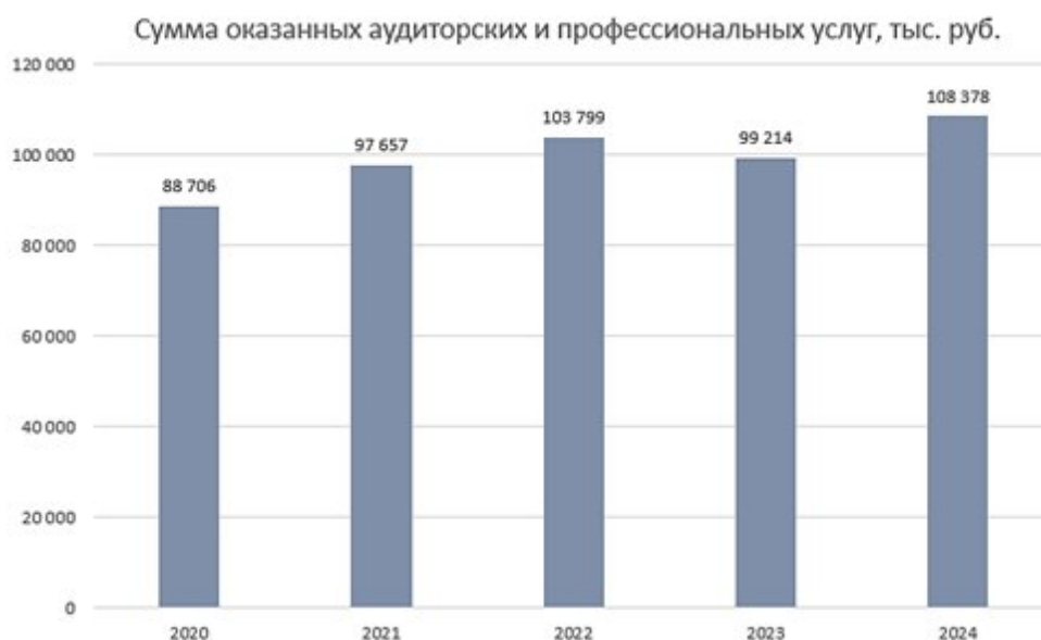
Рисунок 1 – Динамика суммы оказанных аудиторских и профессиональных услуг за 2020–2024 гг.

Примечание: составлено по данным с источника [1]