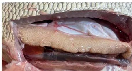
Рисунок 2. – Парные яичники пятигодовалых самок язя

На рисунках 1 и 2 хорошо видно, как условия выращивания влияют на формирование гонад: при низкой плотности (рисунок 1) гонады формируются лучше, а при высокой плотности (рисунок 2) развитие ухудшается.