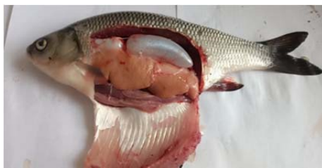
Рисунок 1. – Парные яичники четырехгодовалых самок язя

Так, четырехлетки язя в осенний период, выращенные в поликультуре имели хорошие показатели экстерьера – их масса тела составляла 534 г, а длина – 28,5 см. Масса гонад при этом была 66,2 г. К весне все показатели экстерьера еще больше улучшились. Средняя длина тела самок четырехлетков язя увеличилась на 11,4 см (до 34,40 см), общая средняя масса тела возросла на 438 г (в 5,6 раза) и составила 539,60 г. Цвет яичников изменился и стал ярко-оранжевого цвета. Весной у четырехгодовалых язя масса парных гонад самок увеличилась на 59,7 г (в 10,2 раза) по сравнению с трехлетками и составила 104 г. На основании литературных данных и визуального осмотра было предположено, что половые органы находились на 4 стадии развития. На этой стадии гонады занимают практически всю полость тела, половые продукты не вытекают, кровеносная система хорошо развита [2]. Икринки крупные, желтые, легко отделяются друг от друга, что наглядно видно на рисунке 1. Эти данные свидетельствуют о высокой степени зрелости и хороших условиях выращивания.