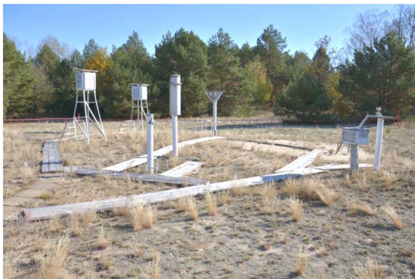
Рисунок 1. – Метеоплощадка

На «Исследовательской станции Масаны им. В.Н.Федорова» имеется метеорологическая площадка, где расположены основные метеорологические приборы и оборудование для производства метеорологических наблюдений в приземном слое атмосферы. Метеорологические наблюдения ведутся круглосуточно вахтовым персоналом согласно [1].