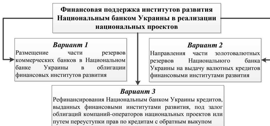
Рисунок 2 – Варианты финансовой поддержки институтов развития Национальным банком Украины

Обязательным условием является направление полученных от рефинансирования средств на дальнейшее кредитование субъектов бизнеса, что обеспечивает мультипликационный эффект программы. Как показывают данные таблицы, объем дополнительных кредитных ресурсов для финансирования национальных проектов, полученных за счет рефинансирования кредита в сумме 160 млн. грн. Национальным банком Украины, составляет 6,7 млн. грн.