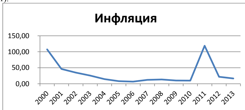
Рисунок 1 – Темпы инфляции в Беларуси [2]

инфляции остаётся острой для нашей страны, особенно остро проблема инфляции выразилась в 2011 г (рисунок 1).