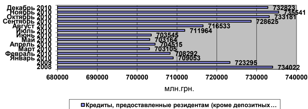
Рисунок 2 – Динамика предоставленных кредитов банковской системой Украины на протяжении 2008 – 2010 гг. [2]

Из рис. 2 видно, что только во II-м полугодии 2010 г. банки начали постепенно возобновлять кредитование экономики. За период с июля по декабрь 2010 г. рост кредитной задолженности банков составил 29278 млн. грн., что обеспечило в целом рост объемов кредитования в 2010 г. сравнительно с 2009 г. всего лишь на 1,3%. Причем докризисного уровня кредитной задолженности (734022 млн. грн. в 2008 г.) пока не удалось достичь даже при условиях постоянной тенденции возобновления доверия населения к банковской системе (рост в течении 2010 г. банковских депозитов на 25,8% сравнительно с 2009 г.) и мероприятиям Национального банка Украины (НБУ) относительно стимулирования кредитной активности банков (постепенное снижение учетной ставки НБУ с 9,5% до 7,75%) [2].