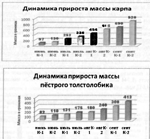
Рисунок 3 и 4 – Сезонная динамика прироста массы карпа и пестрого толстолобика

Темп роста разных видов рыб при пастбищном (водоем «Кривичи – 1»: К-1) и интегрированном рыбоводстве (водоем «Кривичи – 2»: К-2) (Рис.3 и рис.4)