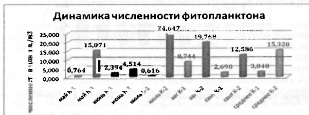
Рисунок 1 – Сезонная динамика численности фитопланктона в водоемах «Кривичи-1» и «Кривичи-2»

Поликультура рыб, используемая для пастбищного и интегрированного рыбоводства, состояла из годовиков карпа ( Cyprinus carpio ), годовиков белого амура ( Stenopharyngodon idella ), годовиков пестрого толстолобика ( Aristichthys nobilis ) и личинки щуки ( Esox lucius ). Зарыбление проводили в апрель-мае 2009 г. Изучение сезонной динамики численности и биомассы фитопланктона в исследованных водоемах показало, что в водоеме «Кривичи-1» наибольшее обилие фитопланктона наблюдалось в августе (8,744 млн. кл/м 3 ), а в водоеме «Кривичи-2» максимальным этот показатель был в июле (24,647 млн. кл/м 3 ) (Рис. 1).