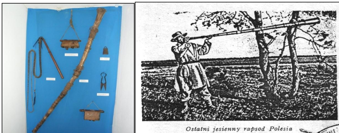
Рис.1. Пастушья труба из Пинского музея Белорусского Полесья и сигнальная труба из книги польского публициста А.Ф. Осендовского

А к вопросу о « трубах городенских » можно добавить, что некоторые специалисты считают автором «Слова о полку Игореве» Кирилла Туровского (около 1130 не позднее 1182) – древнерусского мыслителя, проповедника, автора множества торжественных «Слов», поучений, молитв, канонов. Одним из первых епископов Туровской епархии в XII веке, заслуженно прозванного потомками « Златоустом, паче всех воссиявших на Руси ».