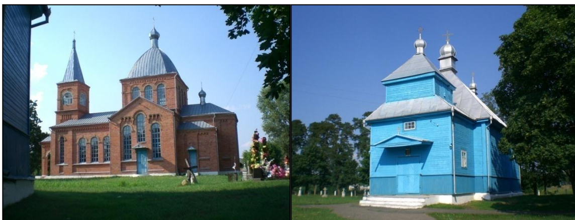
Рис. 2. Городнянские православные Свято–Николаевская и Свято–Троицкая церкви

Эта записка требует уточнения. Дело в том, что в Городной на Пятёнку (праздник великомученицы Параскевы Пятницы) издавна был не престольный праздник, а святок, характерными признаками которого были кирмаш (ярмарка) и приезжие гости из соседних селений. Святок был также и на Воздвиженье. А престольные праздники устанавливались для прихожан по названию церкви (церковных престолов). В Городной – это Свято–Троицкая церковь и Свято–Николаевская. Следовательно, в Городной престольными праздниками являлись и являются до сих пор Троица и Микола (Рис. 2).